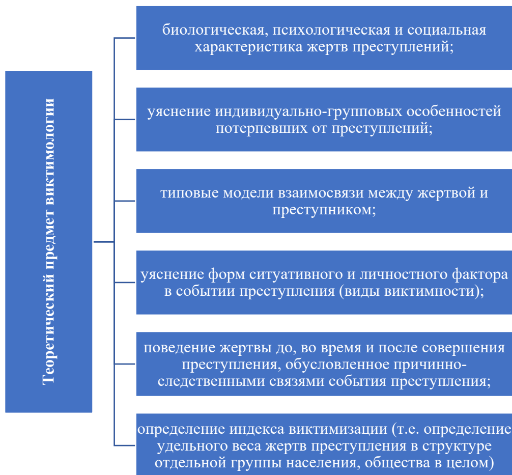
Рисунок 1.1 – теоретический предмет виктимологии

На рисунке 1.1 представим теоретический предмет виктимологии.