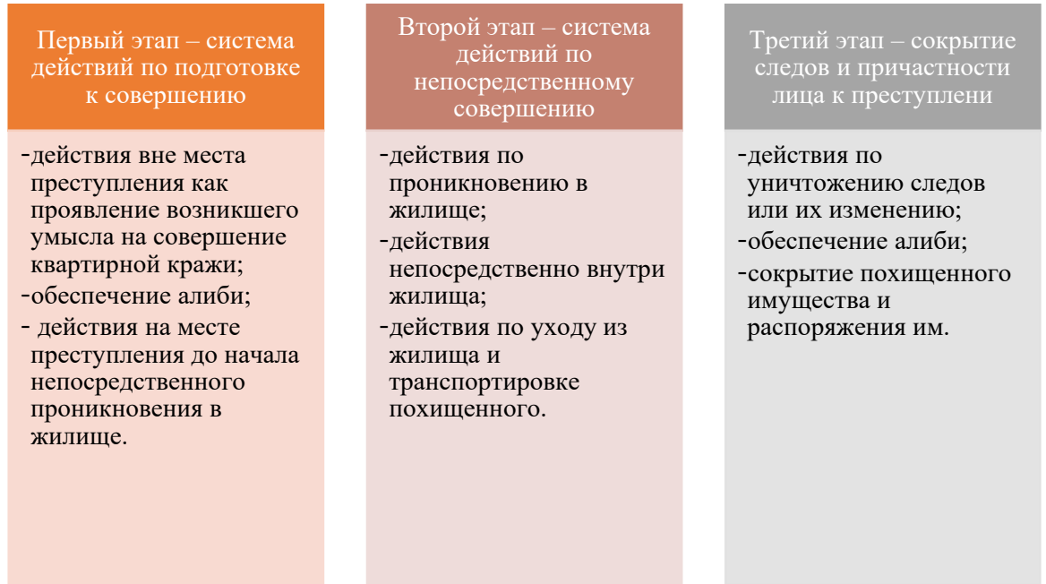
Рисунок 1.3 – этапы системы действий преступника по совершению квартирной кражи

Лицами, совершающими квартирные кражи, могут быть как профессиональные преступники, так и случайные люди, решившиеся на преступление в силу различных обстоятельств.