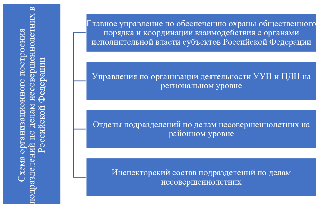
Рисунок 3 – Схема организационного построения подразделений по делам несовершеннолетних в Российской Федерации

По нашему мнению, основным органом рассматриваемой организационной структуры следует считать подразделения регионального уровня, которые призваны осуществлять координацию рассматриваемых подразделений на уровне субъекта федерации.