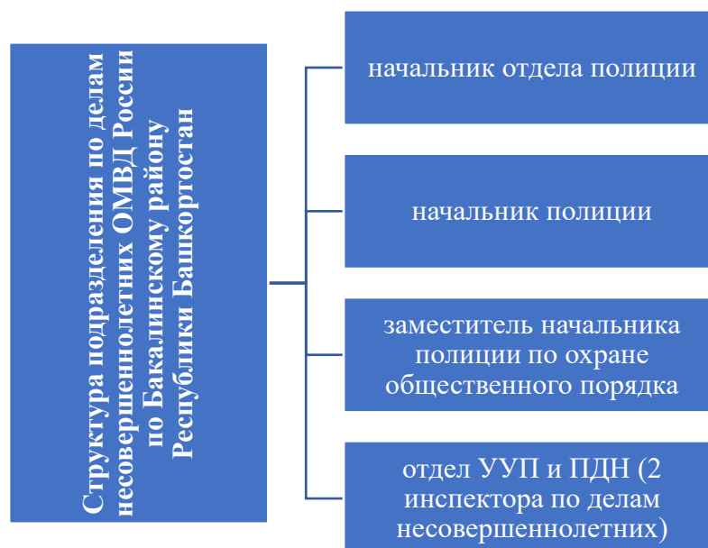
Рисунок 4 - Структура подразделения по делам несовершеннолетних ОМВД России

На рисунке представим структуру подразделения по делам несовершеннолетних ОМВД России по Бакалинскому району Республики Башкортостан.