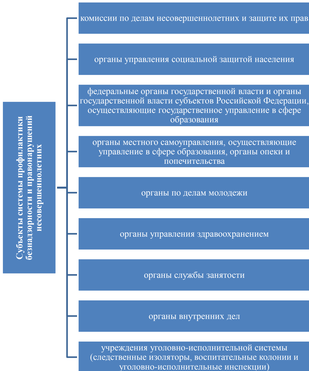
Рис. 1.2 – Субъекты системы профилактики безнадзорности и правонарушений несовершеннолетних

В указанных на рис. 1.2 органах могут создаваться учреждения, осуществляющие отдельные функции по профилактике безнадзорности и правонарушений несовершеннолетних.