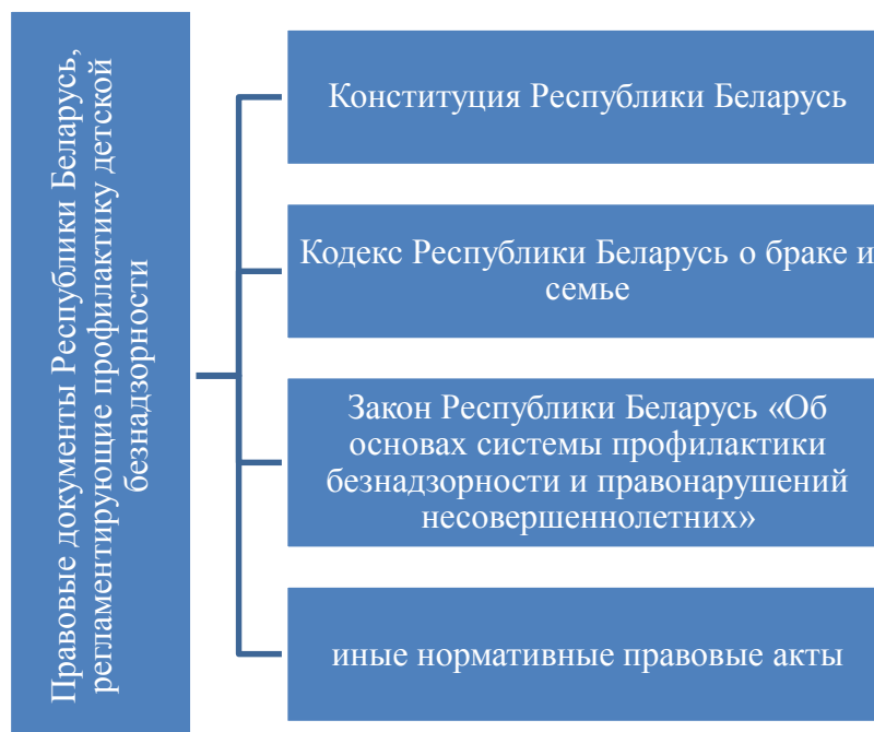
Рис.2.1 – Правовые документы Республики Беларусь, регламентирующие профилактику детской безнадзорности

В Республике Беларусь профилактика детской безнадзорности осуществляется на основе законодательства, которое включает в себя основные правовые документы, которые мы представили на рис. 2.1.