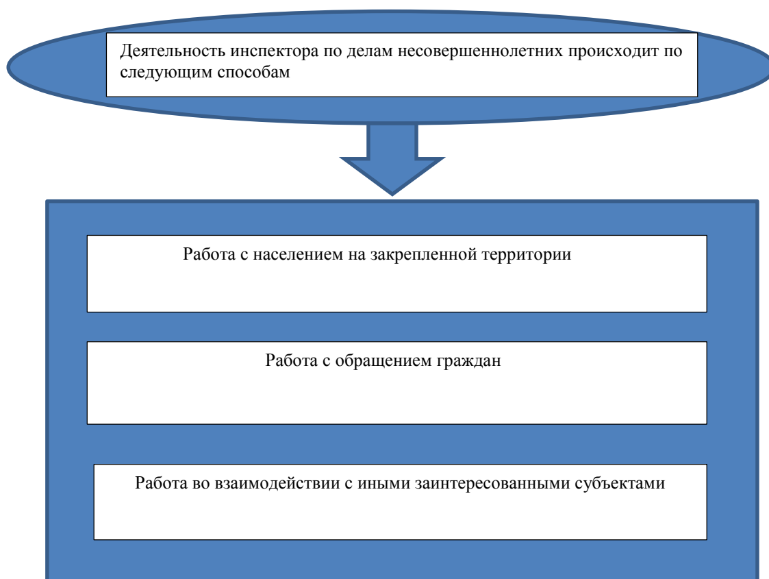
Рис. 2.4 – Способы деятельности инспектора по делам несовершеннолетними.

Деятельность инспектора по делам несовершеннолетних происходит следующими способами, которые изображены на рисунке 2.4.