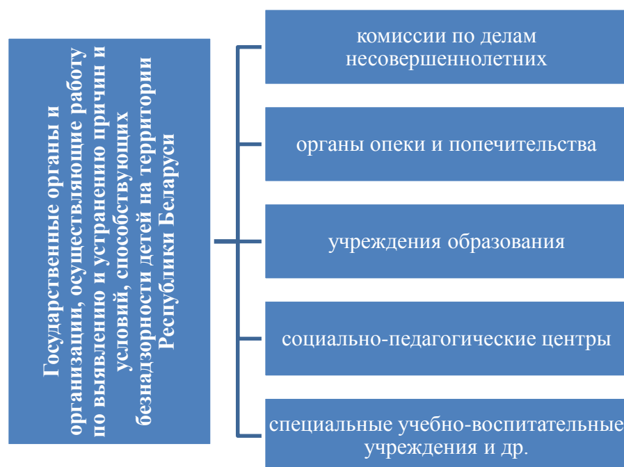
Рис. 2.2 – Государственные органы и организации, осуществляющие работу по выявлению и устранению причин и условий, способствующих безнадзорности детей на территории Республики Беларусь

Система профилактики детской безнадзорности включает в себя различные государственные органы и организации, которые осуществляют работу по выявлению и устранению причин и условий, способствующих безнадзорности детей (рис. 2.2).