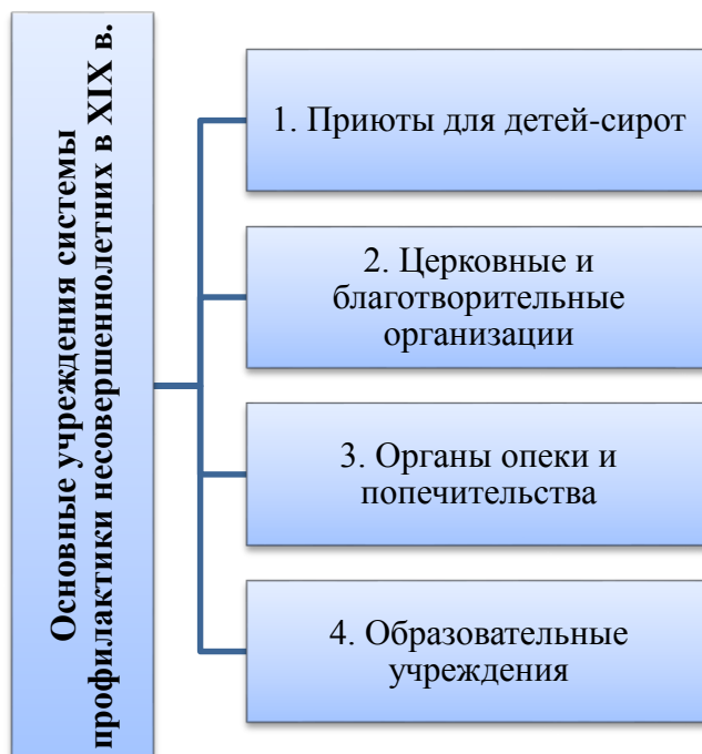
Рис. 1.1 – основные учреждения системы профилактики несовершеннолетних в XIX в.

Так же, в представленном столетии на территории нашего государства начали создаваться органы опеки и попечительства, ответственные за защиту прав детей-сирот и несовершеннолетних, находящихся в трудной жизненной ситуации, которые занимались устройством детей в учреждения, контролем за их благополучием и обеспечением необходимой помощи.