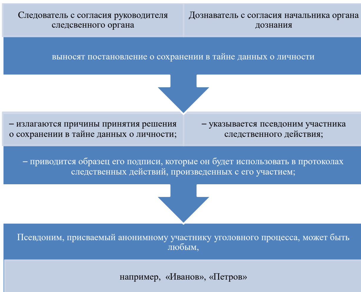
Рисунок 1.2 – Порядок принятия решения о сохранении в тайне данных о личности

На рисунке 1.2 представим порядок принятия решения о «конверте-псевдониме».