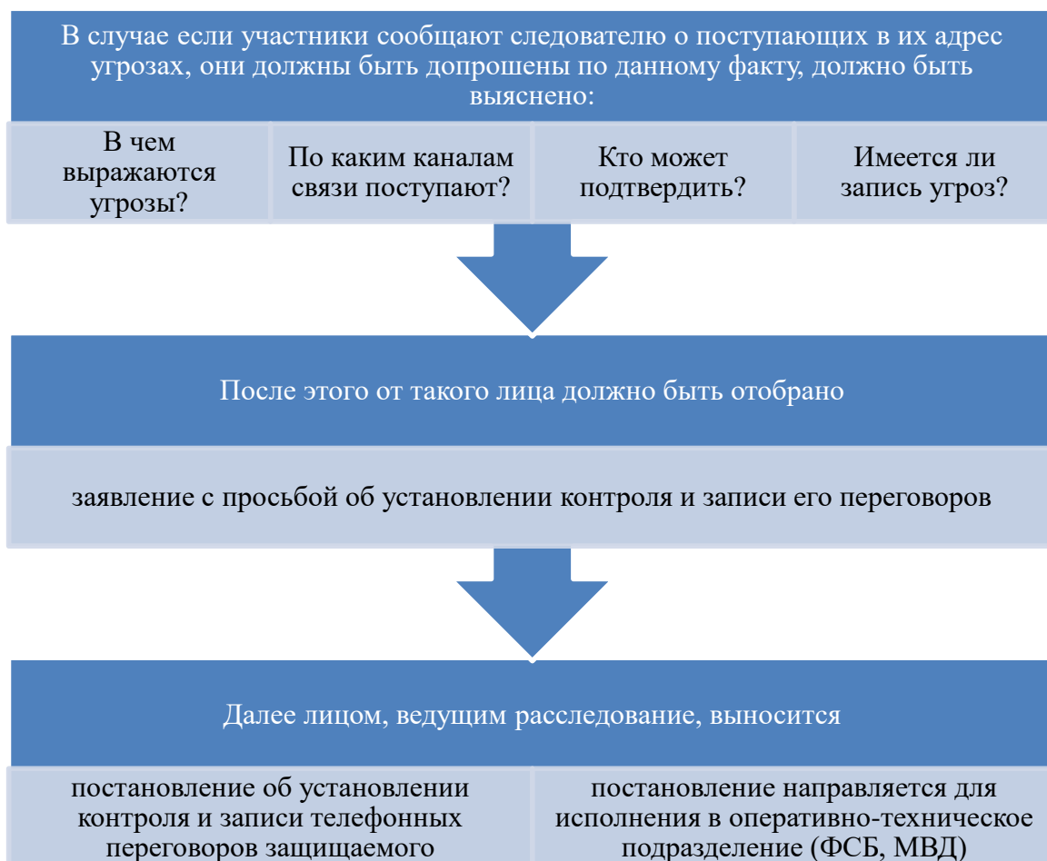
Рисунок 1.4 – Порядок производства КиЗТП в случае высказывания участникам угрозы

на диктофон, это будет являться доказательством о реальности высказанного запугивания. Но если угрозы выражены в иностранной форме или зашифрованы, это будет создавать трудности в понимании, а в дальнейшем и в доказывании.