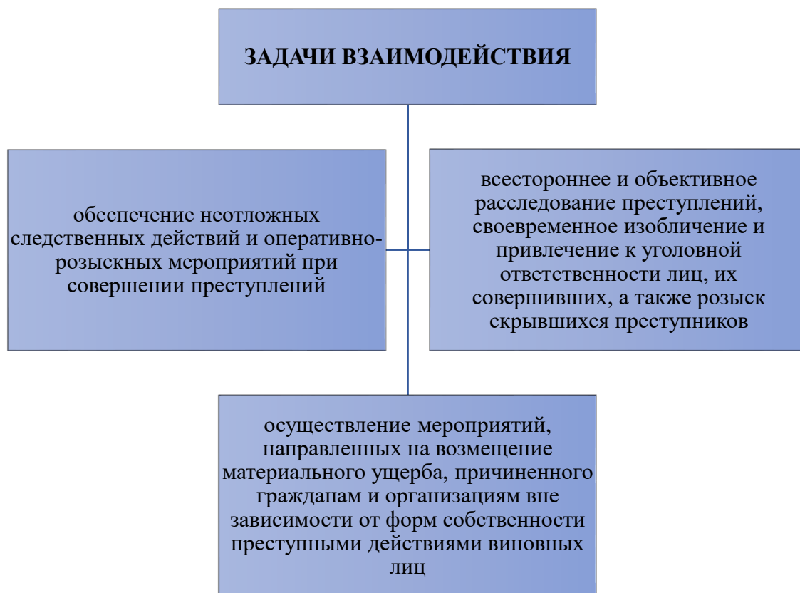
Рисунок 1.1 – задачи взаимодействия

Кроме принципов законодателем определены основные задачи взаимодействия (представим их на рисунке 1.1).