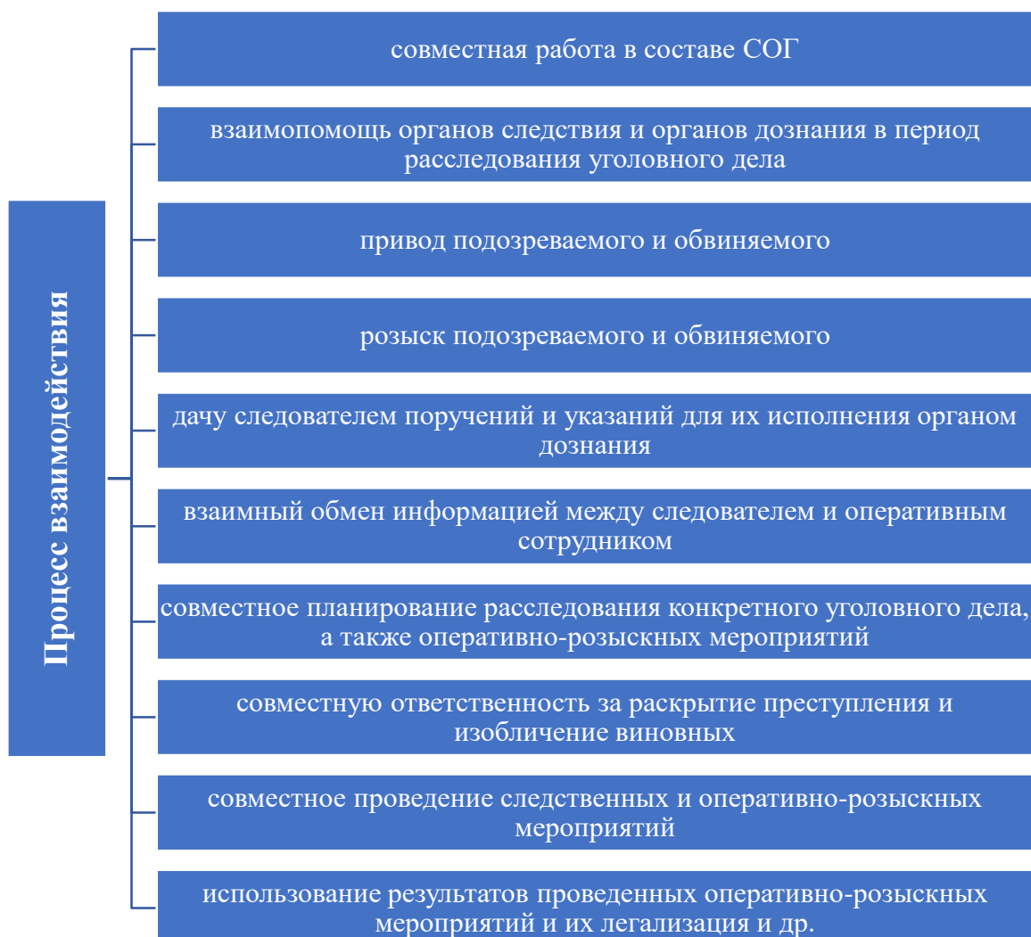
Рисунок 2.1 – процесс взаимодействия следствия и органов дознания

Подследственность определена ст. 151 УПК РФ. На практике, зачастую возникают споры между следователем и дознавателем о том, кто будет обрабатывать первоначальный материал проверки, но такого быть не должно, так как при дежурстве в составе СОГ и следователь и дознаватель подчиняются старшему оперативному дежурному отдела полиции, который дает им указания о совершении выезда на место совершения преступления с целью сбора информации о случившемся, проведении осмотра места происшествия и других оперативных мероприятий, направленных на раскрытие совершенного преступления.