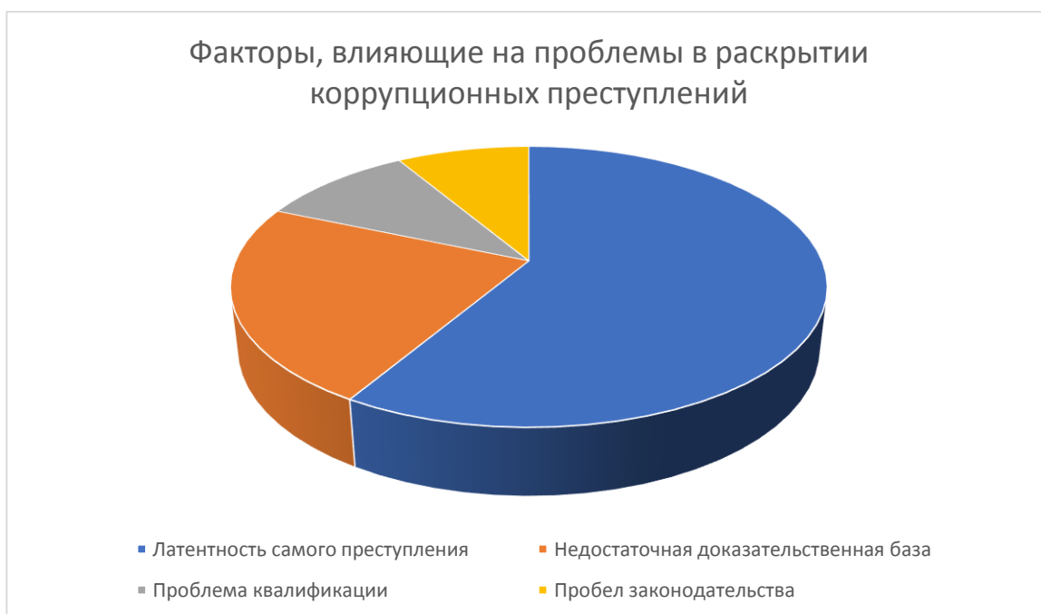
Рис 1. Опрос сотрудников территориального органа

Исходя из графического изображения полученных ответов от сотрудников полиции Отдела МВД России по Мелеузовскому району отметим, что более,