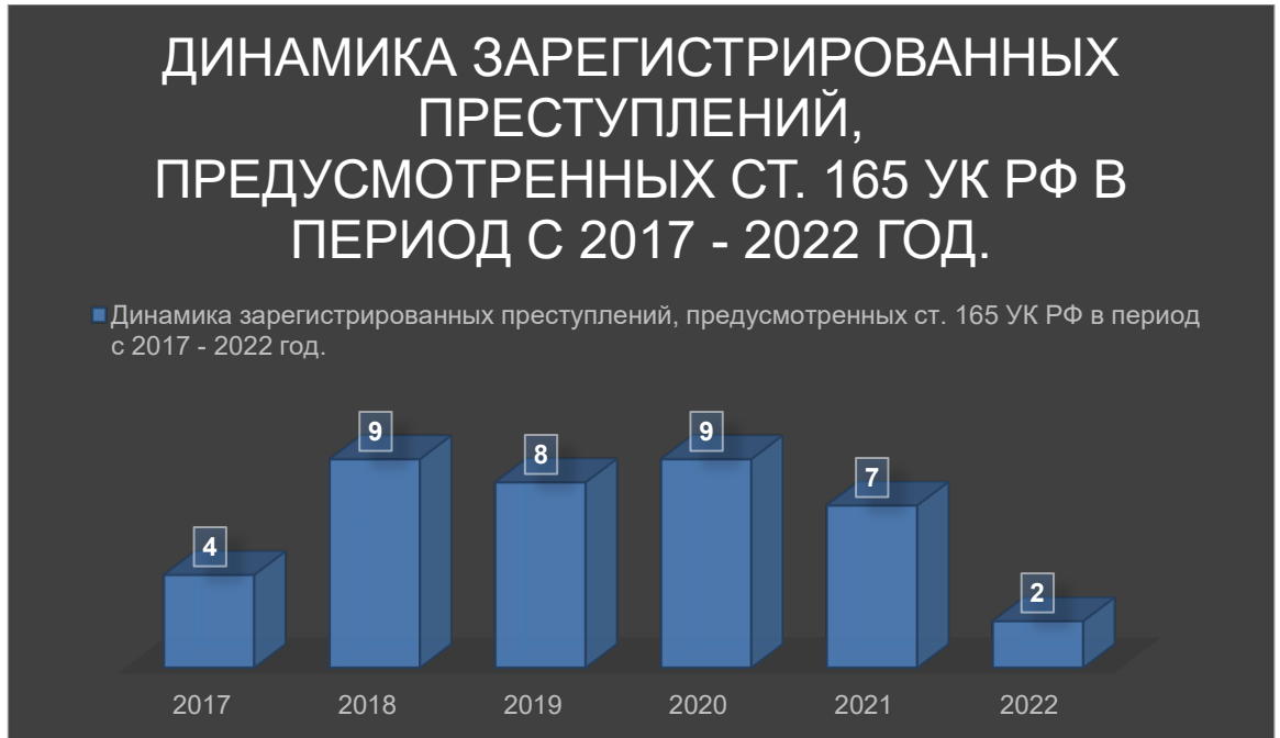
Рис. 2.2. «Динамика зарегистрированных преступлений, предусмотренных ст. 165 УК РФ в период с 2017 по 2022 год».

факт о неактуальности ст. 165 УК РФ на сегодняшний день. Указанное положение зависит от многих факторов, но в большей степени от того, что, к сожалению, сегодня имеют место быть пробелы в законе относительно регламентации процедуры применения ст. 165 УК РФ, что приводит к низкому уровню использования её в практической деятельности.