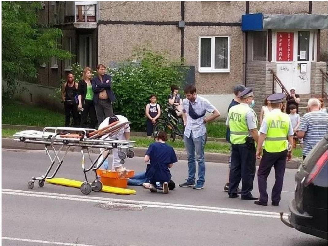
рис. 2.1 - Место совершения дорожно-транспортного происшествия

Например, на рисунке 1 изображена ситуация, где автомобиль черного цвета, совершил наезд на мужчину, в результате которого тот скончался.