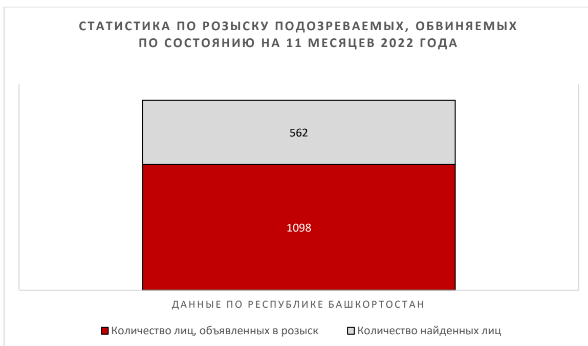
Рисунок 2. Статистика по розыску подозреваемых, обвиняемых по состоянию на 11 месяцев 2022 года. Данные по Республике Башкортостан

Анализируя представленные сведения, необходимо отметить, что в целом по стране процент успешности розыскных действий составляет 42,98, а по Республике Башкортостан 51,18, что свидетельствует о большей эффективности организации розыска в республике, чем в большинстве других субъектов