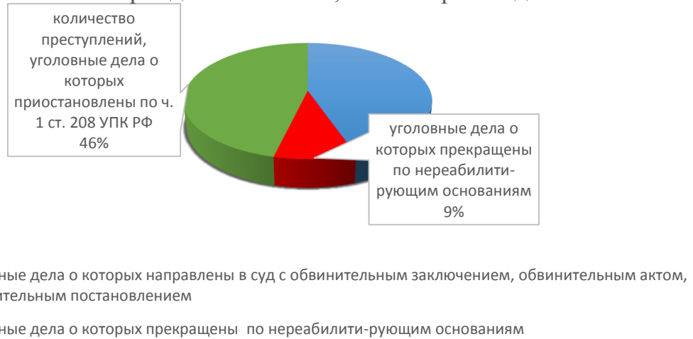
Рисунок 3. Количество преступлений в Республике Башкортостан за 2020 год, уголовные дела о которых находились в производстве на начало года или зарегистрированы в отчетный период в количестве, в т.ч. не расследованные