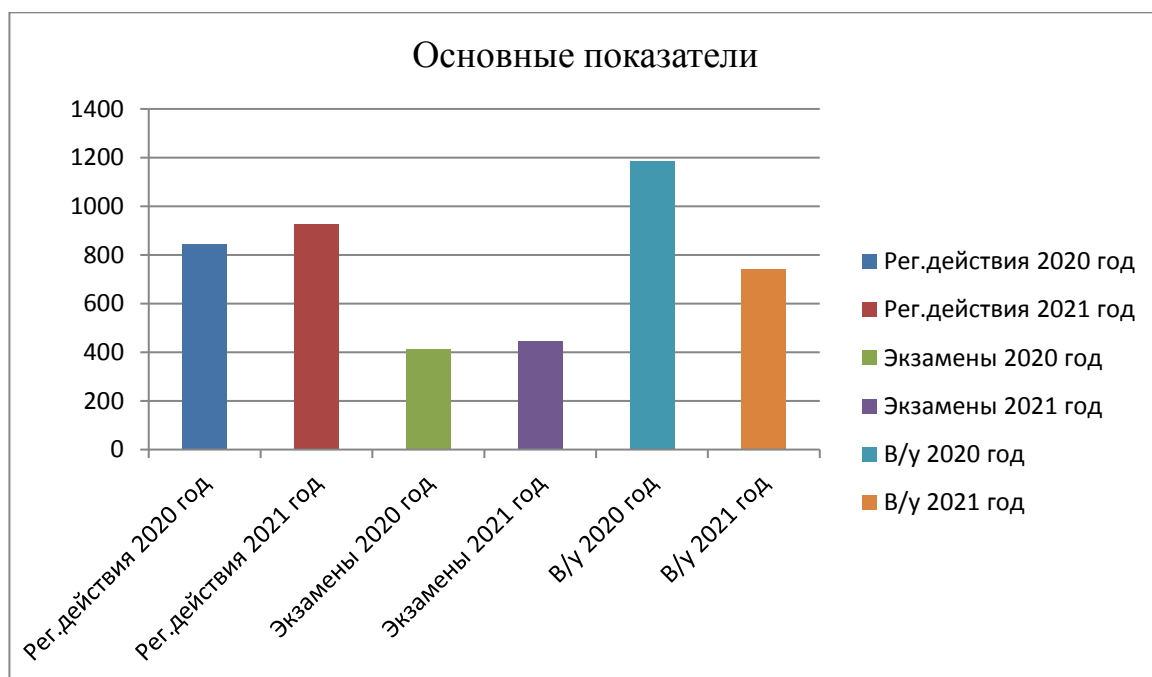
Рисунок 2.1 – Оценочные показатели работы ГИБДД ОМВД по городскому округу ЗАТО г.Межгорье Республике Башкортостан

Главным оценочным признаком работы отделения представляется характеристика аварийности на обслуживаемой территории. Так, за прошедший период государственными инспекторами произведено 846 (928 аналогичный период прошлого года (далее АППГ)) - 9%, регистрационных действий, проведено 415 (444 АППГ) - 6% человеко-экзаменов, выдано 1185 (743 АППГ) + 59% водительских удостоверений «см. рис. 2.1».