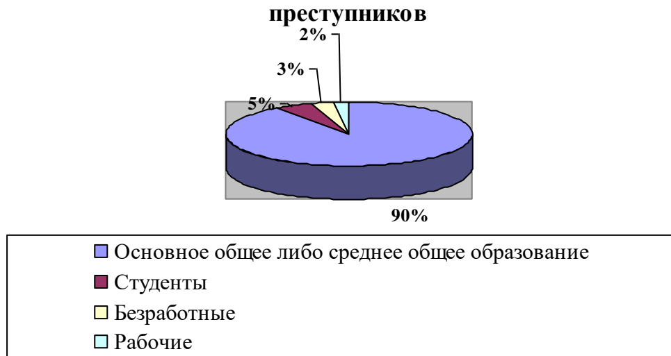
рис. 1.1. Диаграмма уровня образования несовершеннолетних преступников

Исследование семейного положения подростков, совершающих общественно-опасные деяния, показало, что оно имеет большое значение, поскольку именно в семье формируются основные качества личности, такие как щедрость, великодушие, доброжелательность, дружелюбие. Большую роль играет состав семьи. Около 57% несовершеннолетних преступников воспитывались в полной семье, то есть в которых были отец и мать, в остальных случаях несовершеннолетние преступники воспитывались в условно-полных семьях, 38,7% - воспитывались матерью и отчимом, 3,6% - отцом и мачехой, у остальных несовершеннолетних, 0,7% - не было законных представителей.