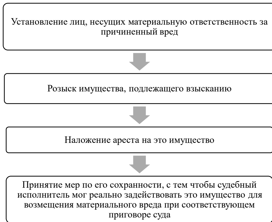
Рисунок 1.3 - Процессуальные действия, которые должны предпринять следователь для обеспечения возмещения имущественного вреда потерпевшему

Следователь при наличии достаточных данных о причинении преступлением материального вреда обязан предпринять процессуальные действия (рисунок 1.2), направленные на возможно полное возмещение причиненного ущерба.