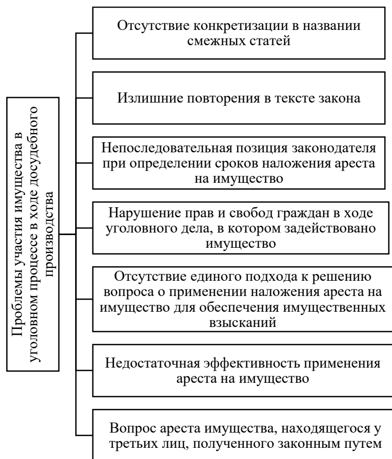
Рисунок 2.1 - Проблемы участия имущества в уголовном процессе в ходе досудебного производства на уровне законодательства

Проблемы, которые являются причиной низкой эффективности работы в сфере возмещения имущественного вреда на стадии предварительного расследования уголовных дел, условно можно разделить на три группы: