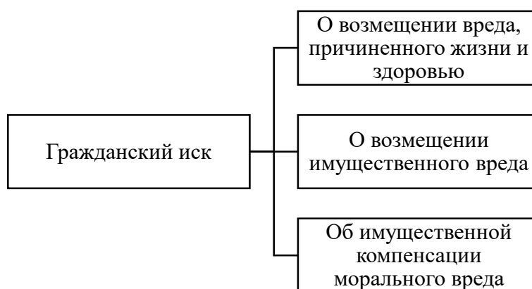
Рисунок 1.2 - Виды гражданского иска

К.В. Вдовкин указывает на то, что на сегодняшний день вопрос о гражданском иске в уголовном процессе решен на законодательном уровне в пользу целесообразности единого рассмотрения уголовного обвинения и вытекающих из него исковых требований, то активно поддержано правоприменительной практикой 2 .